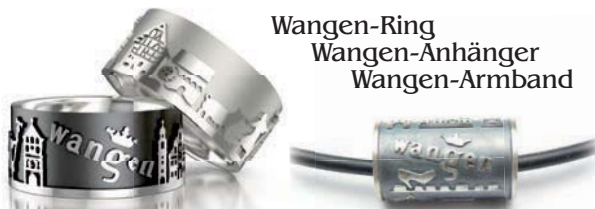
Wangen-Ring Wangen-Anhänger Wangen-Armband

Individuelle und handgefertigte Schmuckstücke aus unserer Goldschmiede