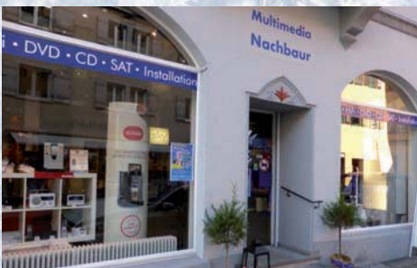
Wenn's um DAB-Radios, Fernseher, HiFi und Elektrogeräte führender Hersteller geht. Nachbaur Multimedia in der Zunfthausgasse in Wangen verkauft und repariert