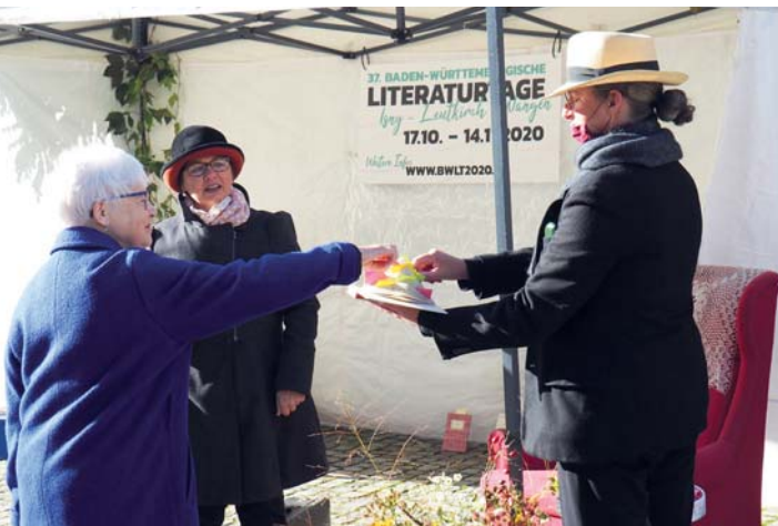
37. Baden-Württembergische Literaturtage im Allgäu