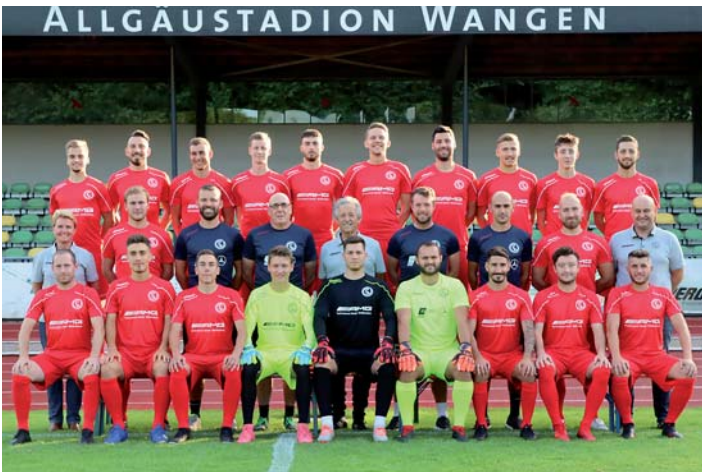
Mannschaftsfoto FC Wangen 05

Wangen aktuell: Apropos Spielerinnen, wie sieht es mit einer Frauenmannschaft beim FC Wangen aus?