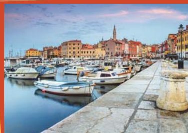
Abenddämmerung im wunderschönen Rovinj.

all spürbare Kultur und die abwechslungsreiche Geschichte. Istrien ist Urlaub pur! Sie übernachten in einem 4-Sterne-Wellness-Hotel in Rabac nur wenige Schritte zum Strand und 800 m zum Ortszentrum! Getränke zum Abendessen inklusive. Freie Nutzung von Hallenbad, Sauna Swimming-Pool und Fitnesscenter. Ein umfangreiches Inklusivprogramm lässt keine Wünsche mehr offen und runden das Angebot ab: z.B. ganztägiger Ausflug nach Rovinj & Pula sowie Opatija & Rijeka.