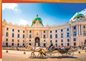
Alte Hofburg in Wien